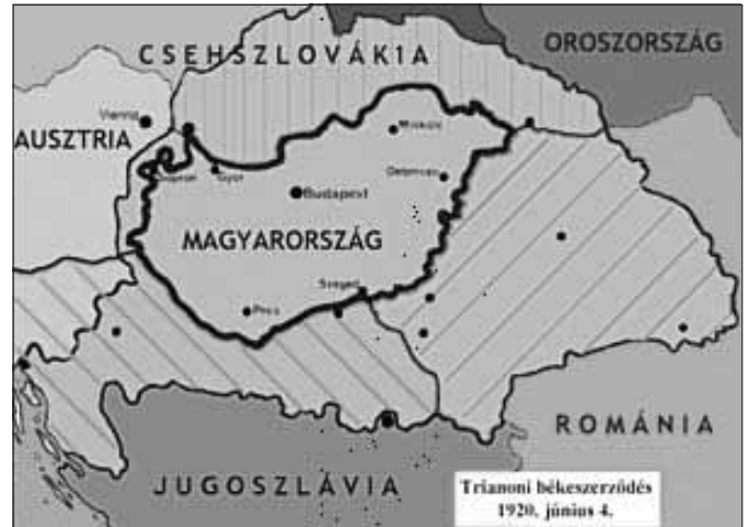
Magyarország új határai

A magyar delegációt a tárgyalásokon gróf Apponyi Albert vezette. Szigorú értelemben vett tárgyalás nem folyt, az Antant képviselői fogadták a magyar küldöttséget, és egyszerűen közölték vele a feltételeket. Ezután átvették a magyar álláspontot tartalmazó dokumentumokat, majd pár nap múlva — lényeg-